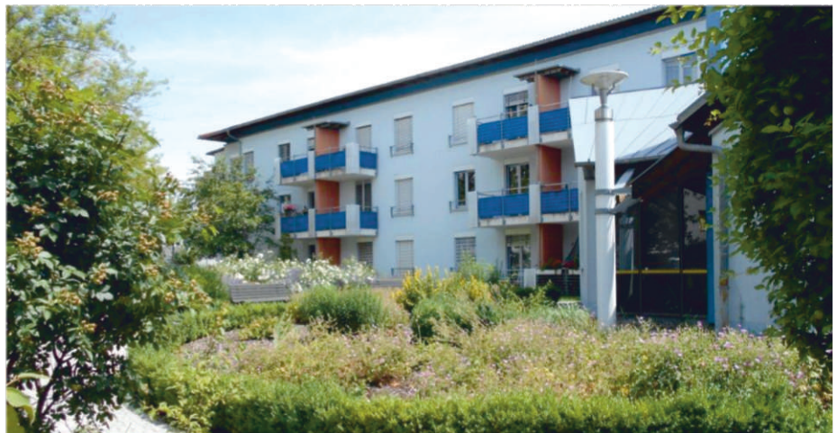
Viele Vorteile des Service Wohnens auf einen Blick:

Telefon 03641 – 484 101 oder per Mail: soz.szh@awo-mittewest-thueringen.de