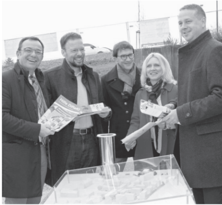
Foto: v.l. Peter Schreiber, Dr. Thomas Nitzsche, Frank und Ellen Herrmann, Michael Rabich

Nach einer umfangreichen Anlauf-, Konzept-, Planungs- und Erschließungsphase sind die Weichen nun gestellt und der erste Stein für den neuen Gebäudekomplex "Quartier IV - Rosepark ATRIUM" an der Naumberger Straße in Jena Nord wurde symbolisch gesetzt sowie eine Zeitkapsel versenkt.